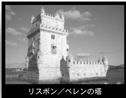
リスボン/ベレンの塔