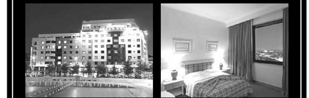
●外観 ●客室(イメージ)

リスボンの中心に位置。1958年開業以来改装と増築を重ね、373室の大ぶりなホテルに成長。街を一望するバーベキューテラスは好評。