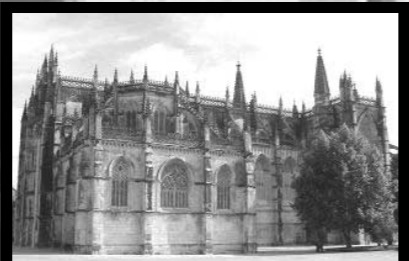
バターリャ/サンタ・マリア修道院