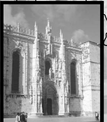
リスボン/ジェロニモス修道院