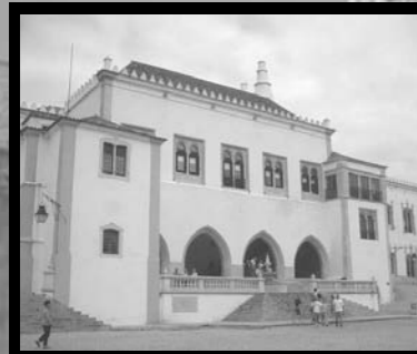
シントラ/シントラ王宮