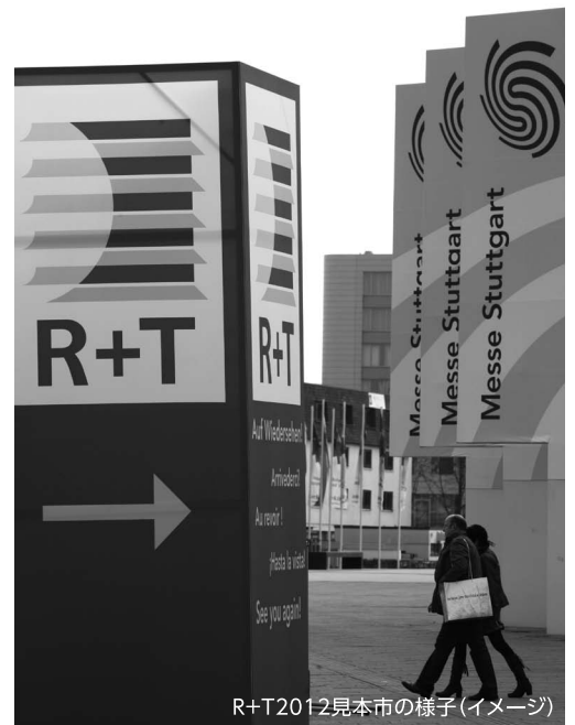
R+T2012見本市の様子(イメージ)