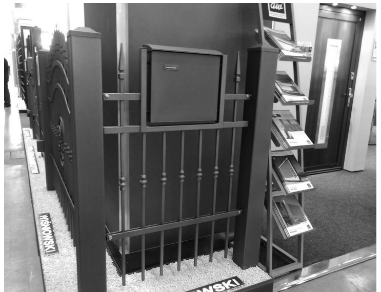
R+T2012見本市の様子(イメージ)